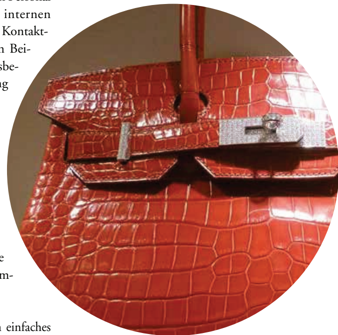
Birkin Bag von Hermès: Jede „Birkin Bag“ von Hermès ist ein handgefertigtes Unikat mit einer Wartezeit von bis zu drei Jahren.

Das Design und die äußerliche Wahrnehmung eines HR-Dokuments wird im Wesentlichen geprägt durch die Form-, Farb- und Sprachgestaltung eines HR-Dokuments. Dem Zusammenspiel zwischen Farben und Formen, der Kombination aus Schriftart und Bild, der Menge an Informationen pro Seite und der Anordnung der Objekte. Die meis-