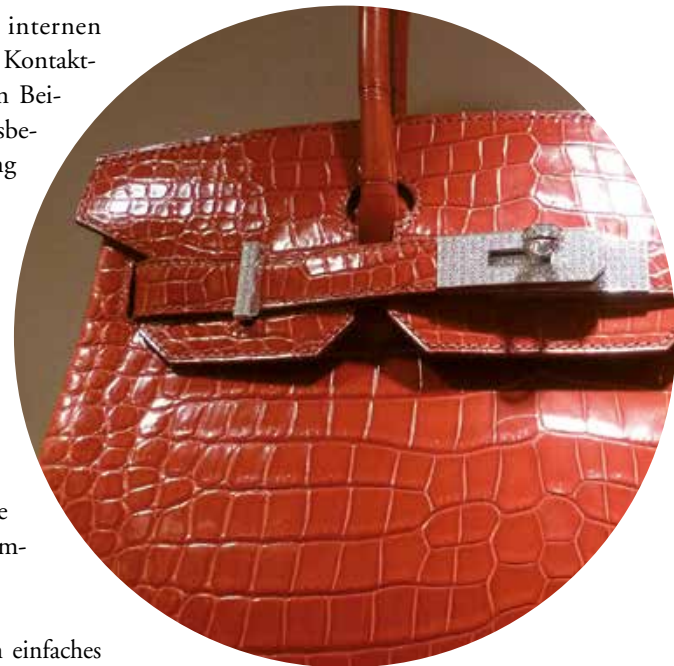
Birkin Bag von Hermès: Jede „Birkin Bag“ von Hermès ist ein handgefertigtes Unikat mit einer Wartezeit von bis zu drei Jahren.

Das Design und die äußerliche Wahrnehmung eines HR-Dokuments wird im Wesentlichen geprägt durch die Form-, Farb- und Sprachgestaltung eines HR-Dokuments. Dem Zusammenspiel zwischen Farben und Formen, der Kombination aus Schriftart und Bild, der Menge an Informationen pro Seite und der Anordnung der Objekte. Die meis-