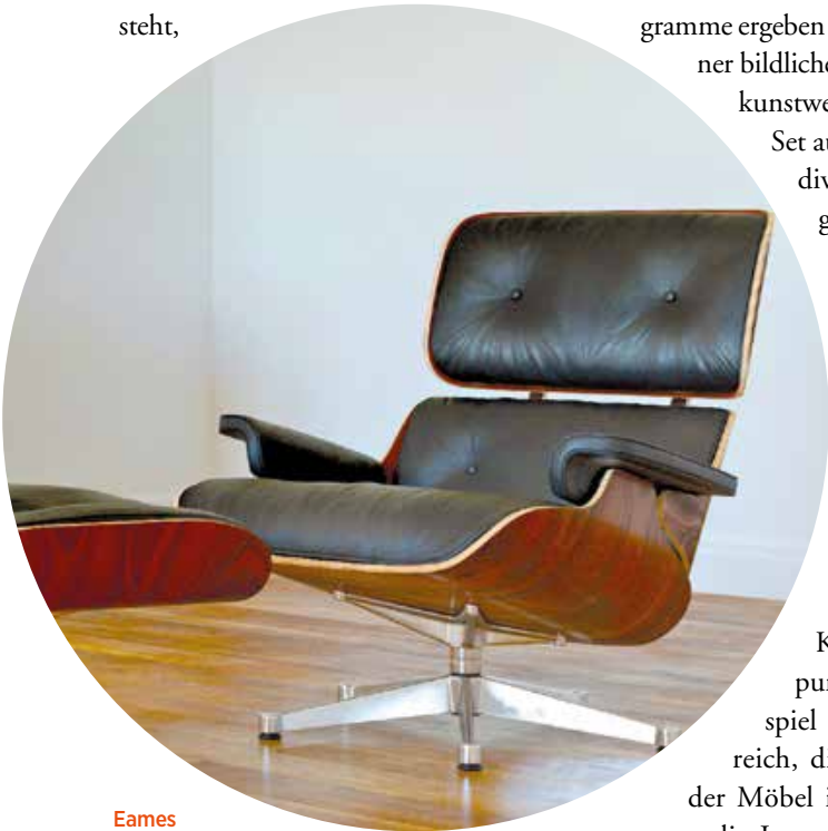
Eames Lounge Chair aus Palisander mit Ottoman: Die funktionale Designsprache der Kunstschule Bauhaus prägt nach wie vor die Welt des Möbeldesigns und der Architektur.

Je besser man diese psychologischen Erkenntnisse und menschlichen Verhaltensmuster versteht,